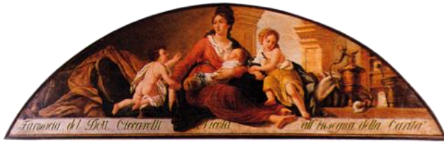
1821 Pierwsze logo CICCARELLI Pharmacy