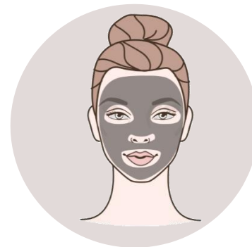
MASKA DO TWARZY