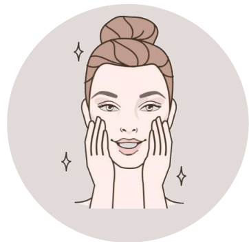
KREM DO TWARZY